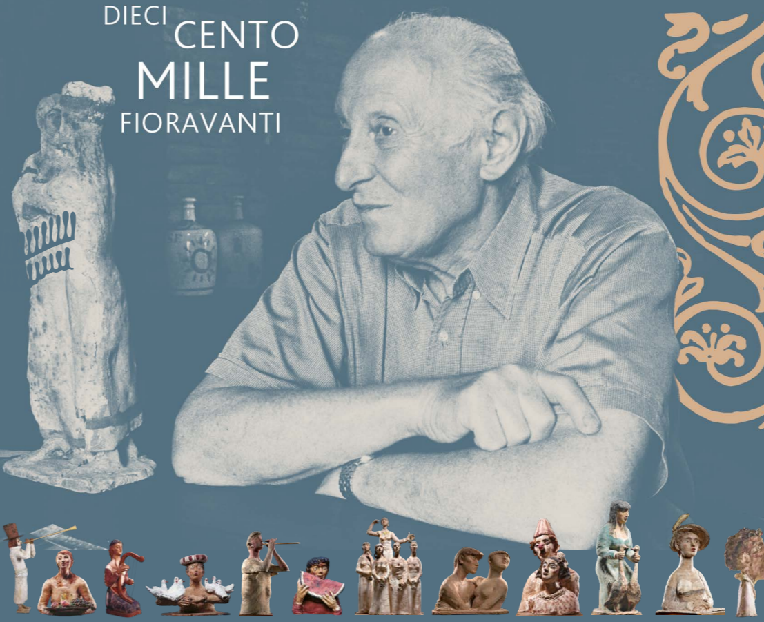
Dopo "Il pifferaio" (2005), "Lucrezia" (2006), "La natura morta" (2007), "La Ragazza con le colombe" (2008), "Il Bambino che mangia il cocomero" (2009), "Aulete" (2010), "Le Vergini Sagge" (2011), "Orfeo ed Euridice" (2012), "Paggiacci II" (2013), "La donna di Metaponto" (2014), "Prima dorata" (2015), "Love" (2016), "Burattinaio I" (2017), "Coppia di saltimbanchi innamorati" (2018), "Giocolieri col fuoco" (2019), "Il profumo del fiore" (2020), "Ragazza con cappellino" (2021), "Caterina" è icona di Borgo Sonoro 2022.

PRO LOCO BORGHI AZ. AGR. GUERRA GIOVANNI via Buondi, 2 - Borghi www.agriturismo-ilgallonero.it